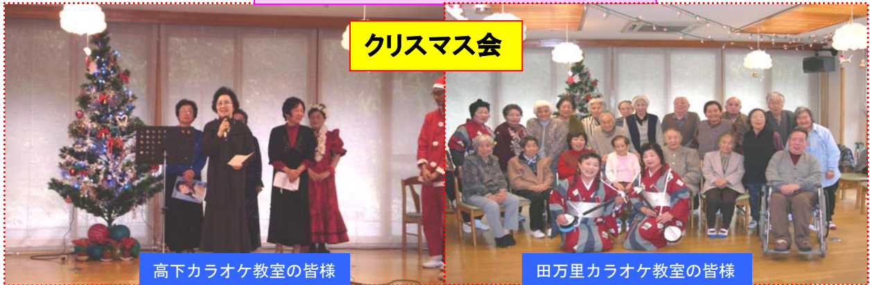
高下カラオケ教室の皆様