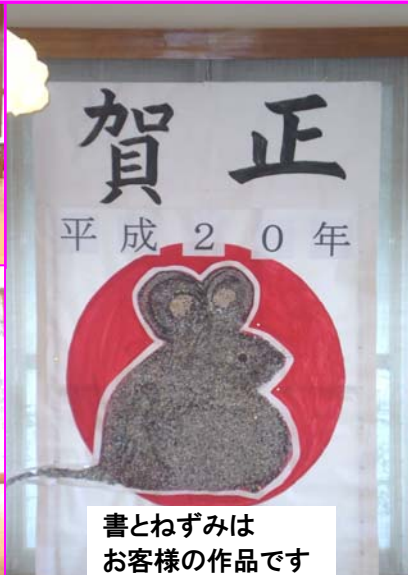
書とねずみは お客様の作品です