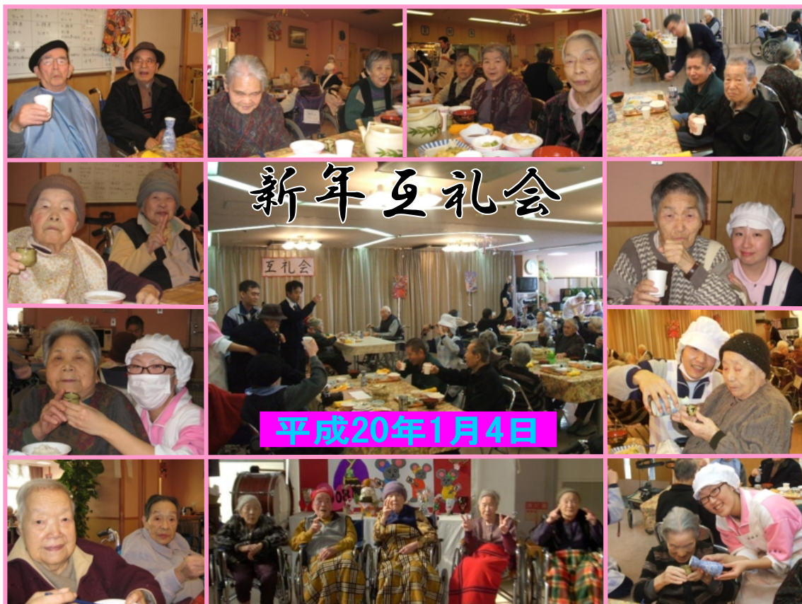
新しい年を迎え、夢と希望に満ち溢れておられます☆