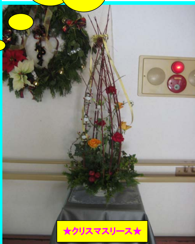
★クリスマスリース★