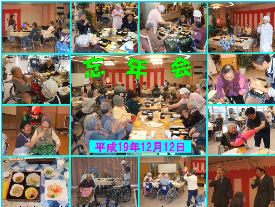
ご馳走に舌鼓をうたれつつ、カラオケやゲームで盛り上がられました♪