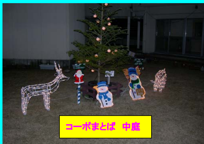
コーポまとは 中庭

2008年のクリスマスの飾りつけ、 イルミネーションにもこだわります。 また、特集をしますので お楽しみに～！！