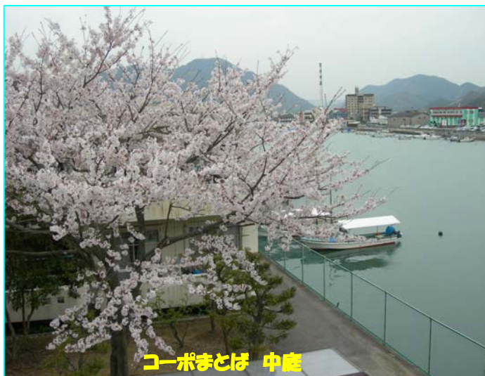
コーポまとば 中庭