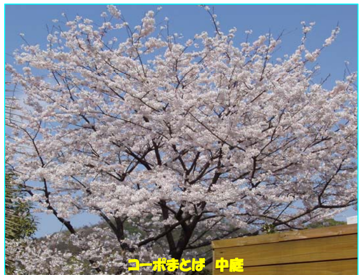
コーポまとば 中庭

「まとばだより 第2号」の内容は、平成20年1月中旬から4月中旬の記事を紹介しております。 今回の特集は『花見会』で、上記のサクラの写真は、的場会で咲いたサクラです。的場会のサクラは、今年もきれいに咲いてくれました。