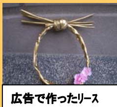
広告で作ったリース