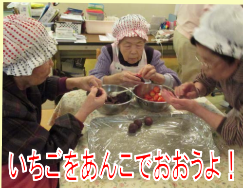
いちごをあんこでおおうよ！