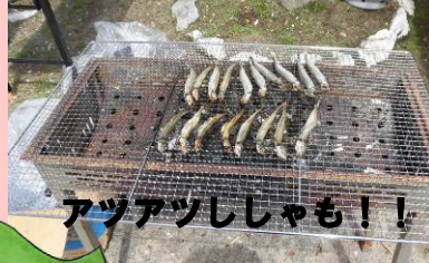
アツアツししゃも！！