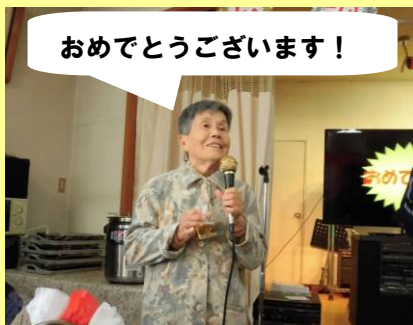
おめでとうございます！